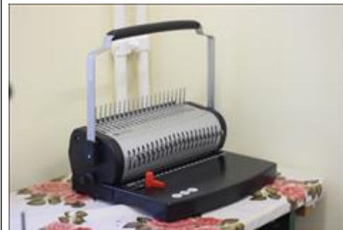
Брошюровщик АНО НПСПО "Благое дело", Свердловская обл., Невьянский р-н, р.п. Верх-Нейвинский, ул. Просвещения 51а, Бумажная мастерская