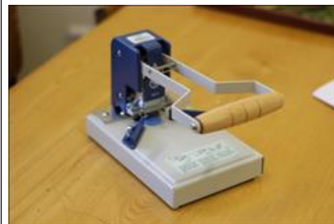
Обрезчик углов со сменными ножами АНО НПСПО "Благое дело", Свердловская обл., Невьянский р-н, р.п. Верх-Нейвинский, ул. Просвещения 51а, Бумажная мастерская