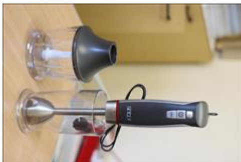
Блендер погружной АНО НПСПО "Благое дело", Свердловская обл., Невьянский р-н, р.п. Верх-Нейвинский, ул. Просвещения 51а, Бумажная мастерская