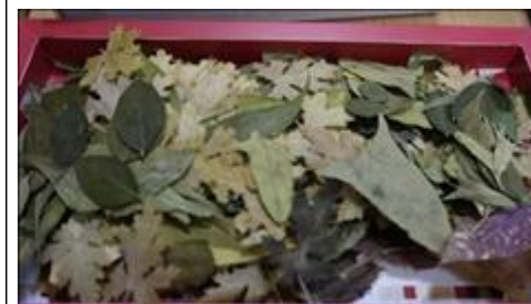
Акция по сбору сырья для мастерской силами волонтеров, школьников и людей с инвалидностью Сырье заготовленное из сухих листьев и цветов