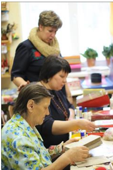
Занятия по обучению работе в бумажной мастерской Изготовление заготовок