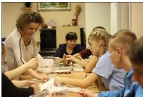
Акция по сбору сырья для мастерской силами волонтеров, школьников и людей с инвалидностью Волонтеры движения "Азимут" приняли участие в акции по сбору сырья для бумажной мастерской