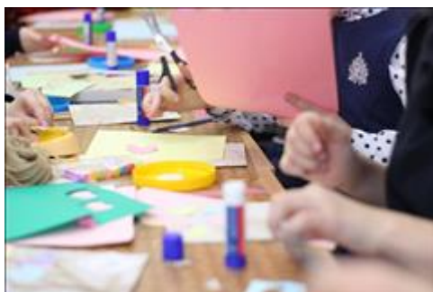
Мастер-класс по изготовлению обложки для блокнота