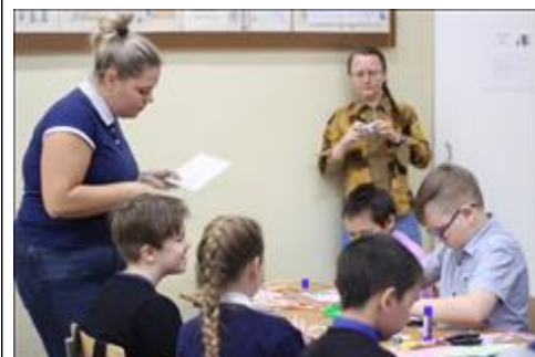
Мастер-класс по изготовлению обложки для блокнота Проведены мастер-классы для учащихся коррекционной школы №2 г. Новоуральска. На мастер- классах учащиеся средней школы изготовили и декорировали обложки для блокнотов. тематика оформления посвящена дню матери.