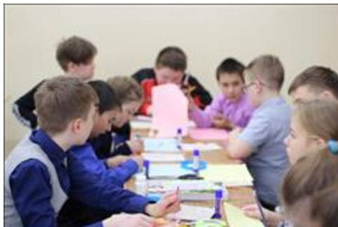
Мастер-класс по изготовлению обложки для блокнота Проведены мастер-классы для учащихся коррекционной школы №2 г. Новоуральска. На мастер-классах учащиеся средней школы изготовили и декорировали обложки для блокнотов. тематика оформления посвящена дню матери.