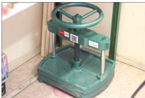
Пресс обжимной АНО НПСПО "Благое дело", Свердловская обл., Невьянский р-н, р.п. Верх-Нейвинский, ул. Просвещения 51а, Бумажная