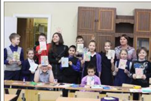
Мастер-класс по изготовлению обложки для блокнота Проведены мастер-классы для учащихся коррекционной школы №2 г. Новоуральска. На мастер- классах учащиеся средней школы изготовили и декорировали обложки для блокнотов. тематика оформления посвящена дню матери.