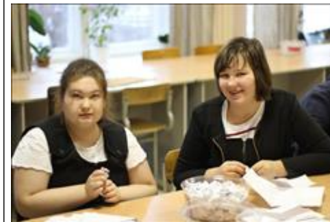
Акция по сбору сырья для мастерской силами волонтеров, школьников и людей с инвалидностью Школьники коррекционной школы приняли участие в акции по сбору сырья для бумажной мастерской