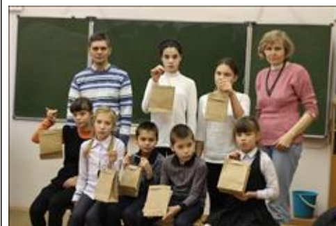
Мастер-класс по изготовлению эко-пакетов