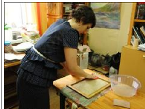
Занятия по обучению работе в бумажной мастерской Изготовление бумаги

Мероприятие: организовано 4 мастер-класса для учащихся коррекционных школ и людей с инвалидностью