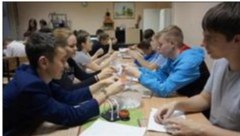
Акция по сбору сырья для мастерской силами волонтеров, школьников и людей с инвалидностью Волонтеры движения "Азимут" приняли участие в акции по сбору сырья для бумажной мастерской