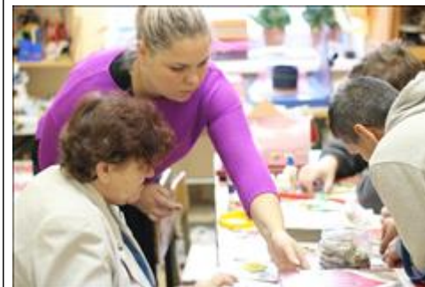
Занятия по обучению работе в бумажной мастерской Изготовление заготовки для блокнотов