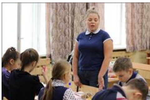
Мастер-класс по изготовлению обложки для блокнота Проведены мастер-классы для учащихся коррекционной школы №2 г. Новоуральска. На мастер- классах учащиеся средней школы изготовили и декорировали обложки для блокнотов. тематика оформления посвящена дню матери.