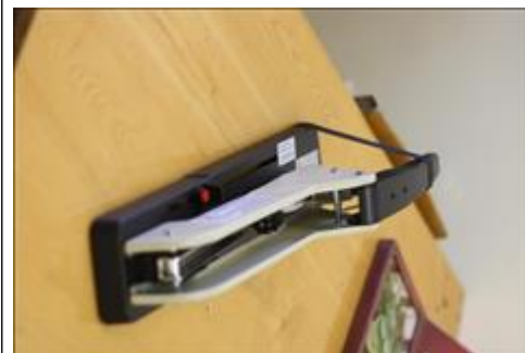
Степлер АНО НПСПО "Благое дело", Свердловская обл., Невьянский р-н, р.п. Верх-Нейвинский, ул. Просвещения 51а, Бумажная