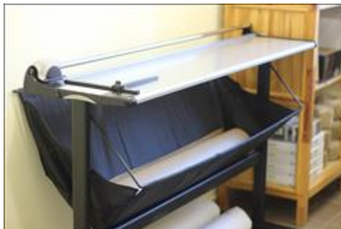
Резак роликовый на станине АНО НПСПО "Благое дело", Свердловская обл., Невьянский р-н, р.п. Верх-Нейвинский, ул. Просвещения 51а, Бумажная мастерская